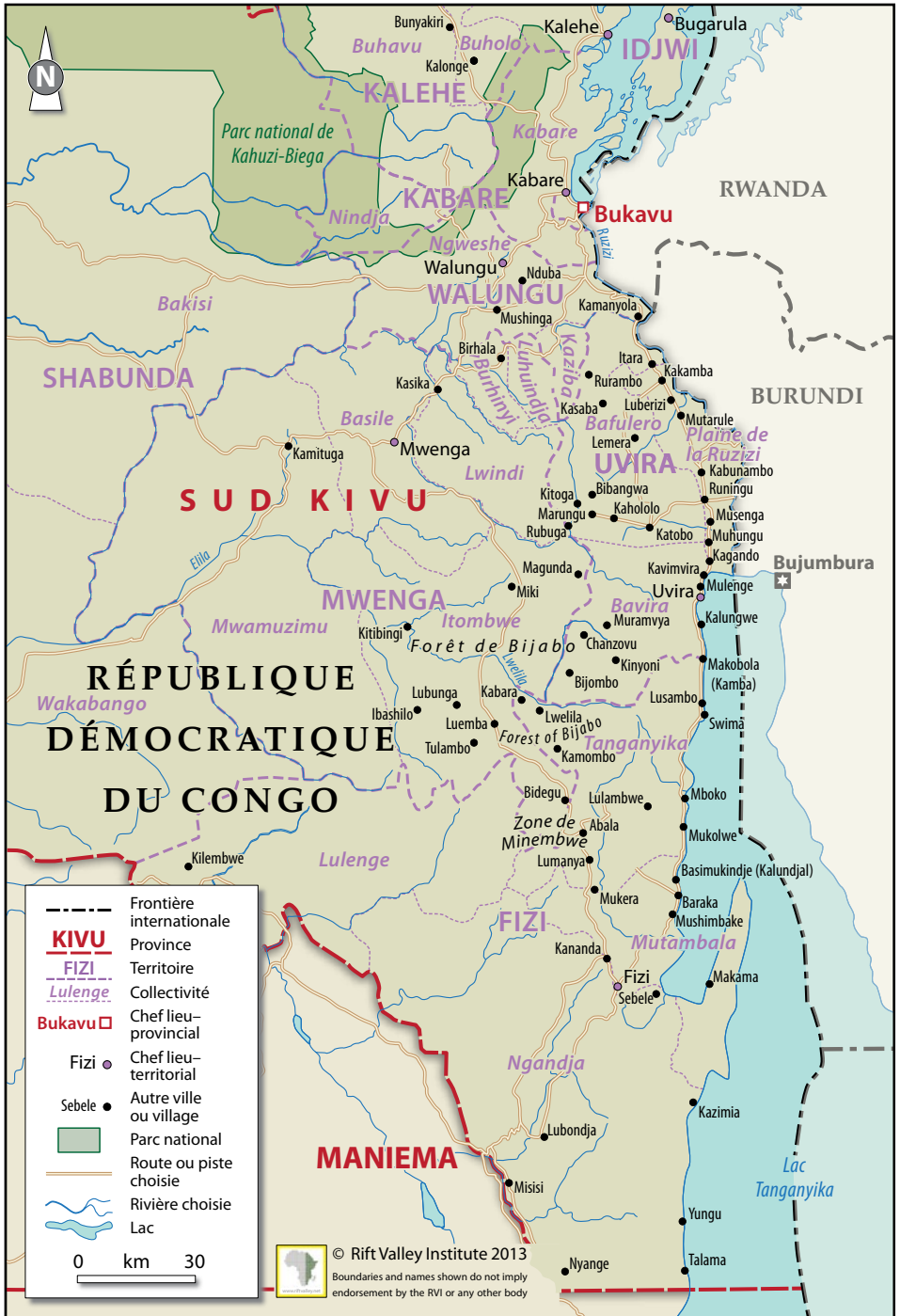
Carte 2. Territoires, collectivités et principales villes du Sud-Kivu